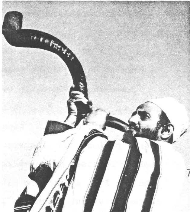
Le shofar alertait les anciens Israélites de diverses choses— des armées qui approchaient, par exemple.

Satan le diable séduit le monde depuis près de six mille ans. Il a convaincu l'humanité que la voie divine est mauvaise, et que la sienne est bonne. C'est difficile à croire, mais lorsque le Christ reviendra sur terre, la plupart des gens vont le considérer comme un ennemi . Satan aura fait croire au monde que le Christ et Ses anges forment un groupe hostile, venu de l'étranger, pour détruire. En désespoir de cause, les gens vont lutter contre Lui. Le Christ devra mettre fin à cette rébellion