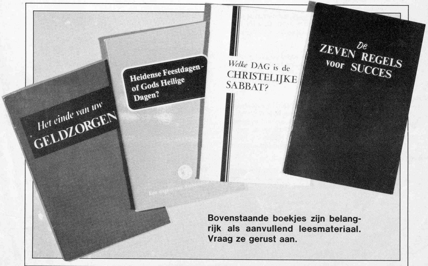
Bovenstaande boekjes zijn belangrijk als aanvullend leesmateriaal. Vraag ze gerust aan.