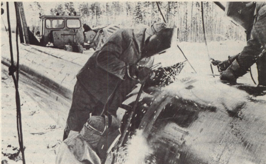
ARBEIDERS AAN HET WERK AAN DE PIJPLEIDING. Het besluit van West-Europa om uit de Sovjet-Unie aardgas te importeren is een doorn in het oog van Amerikaanse regeringsfunctionarissen.

Zo schrijft b.v. Josef Joffe, hoofdredacteur van het Hamburgse weekblad Die Zeit in het nummer van 28 juli 1982 van de Wall Street Journal : „Waar het tegenwoordig om gaat is om de wijsheid van de Amerikaanse politiek, niet om het gelijk. Amerika's vrienden in Europa vragen zich tegenwoordig verbijsterd af: Waarom schaarde de regering Reagan zich achter een kostbare, maar weinig opleverende politiek die alleen maar schipbreuk kon lijden? Toen de overeenkomst met de Sovjet-Unie eenmaal gesloten en getekend was, bestond er nog maar een heel geringe kans dat de Europeanen zich deemoedig aan hun contractuele verplichtingen zouden onttrekken. In de aangelegenheden van staten komt er een punt waarop de kosten van de overwinning de waarde van het oorspronkelijke doel volledig in de schaduw dreigen te stellen.