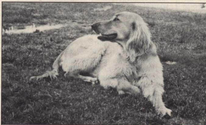
Leo heeft de waardigheid van een leeuw, maar moet machteloos toezien hoe Sir Hans zijn gang gaat.

„Dat is tegen de bijbel!” riep hij zeer verontwaardigd uit. „De bijbel zegt: 'Wat God heeft samengevoegd, mag de mens niet scheiden!' ”