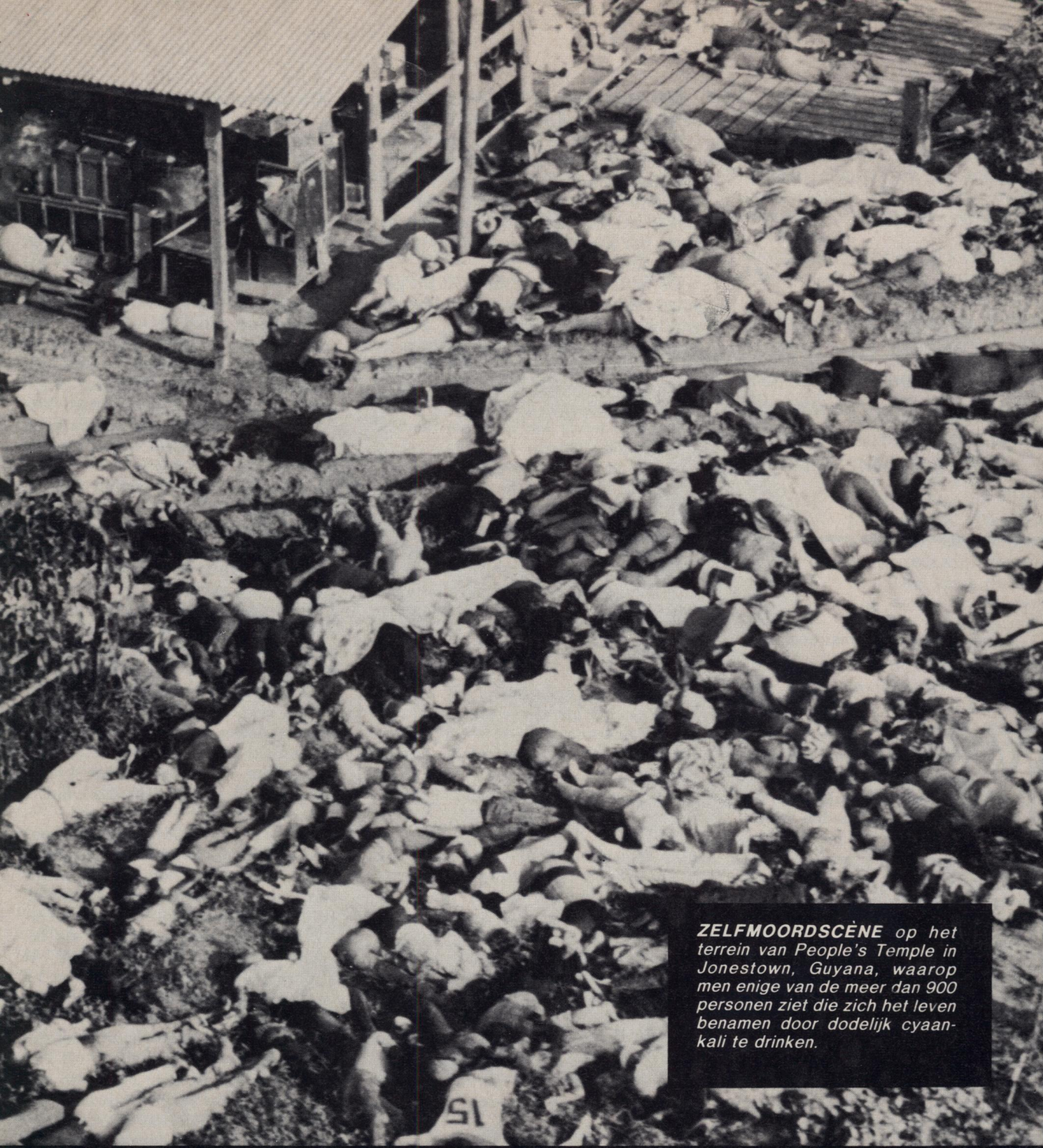
ZELFMOORDSCÈNE op het terrein van People's Temple in Jonestown, Guyana, waarop men enige van de meer dan 900 personen ziet die zich het leven benamen door dodelijk cyaan-kali te drinken.